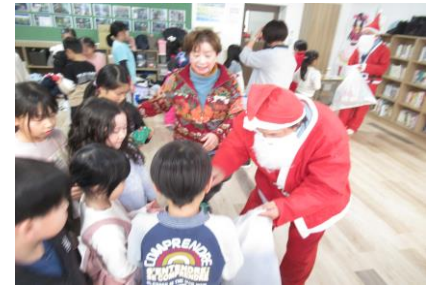
突然のサンタさん登場に、大歓声！！

帯広市子どもの居場所づくり事業「おおぞらっ子クラブ」は、地域のボランティアの方々による子ども達が安心して遊ぶことのできる取組です。月に1回程度、工作やレクレーションを通じて大人や学年を超えたお友達と楽しく交流しています。